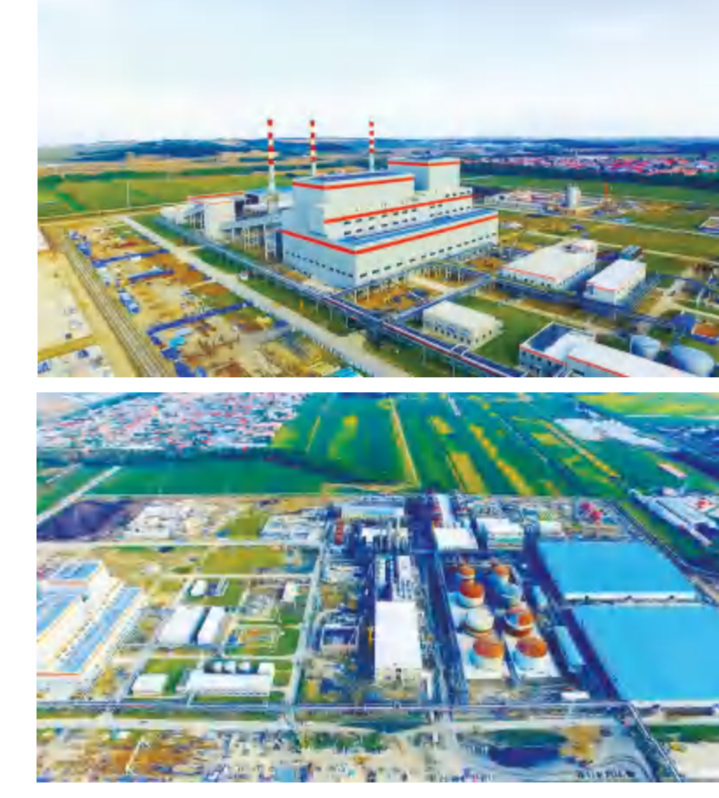
龙安二公司宝清万里河达一亿万吨年玉米深加工项目