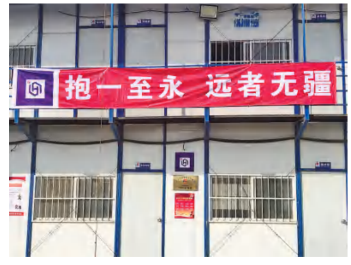
龙安二公司舟山浙石化400万吨年一体化项目