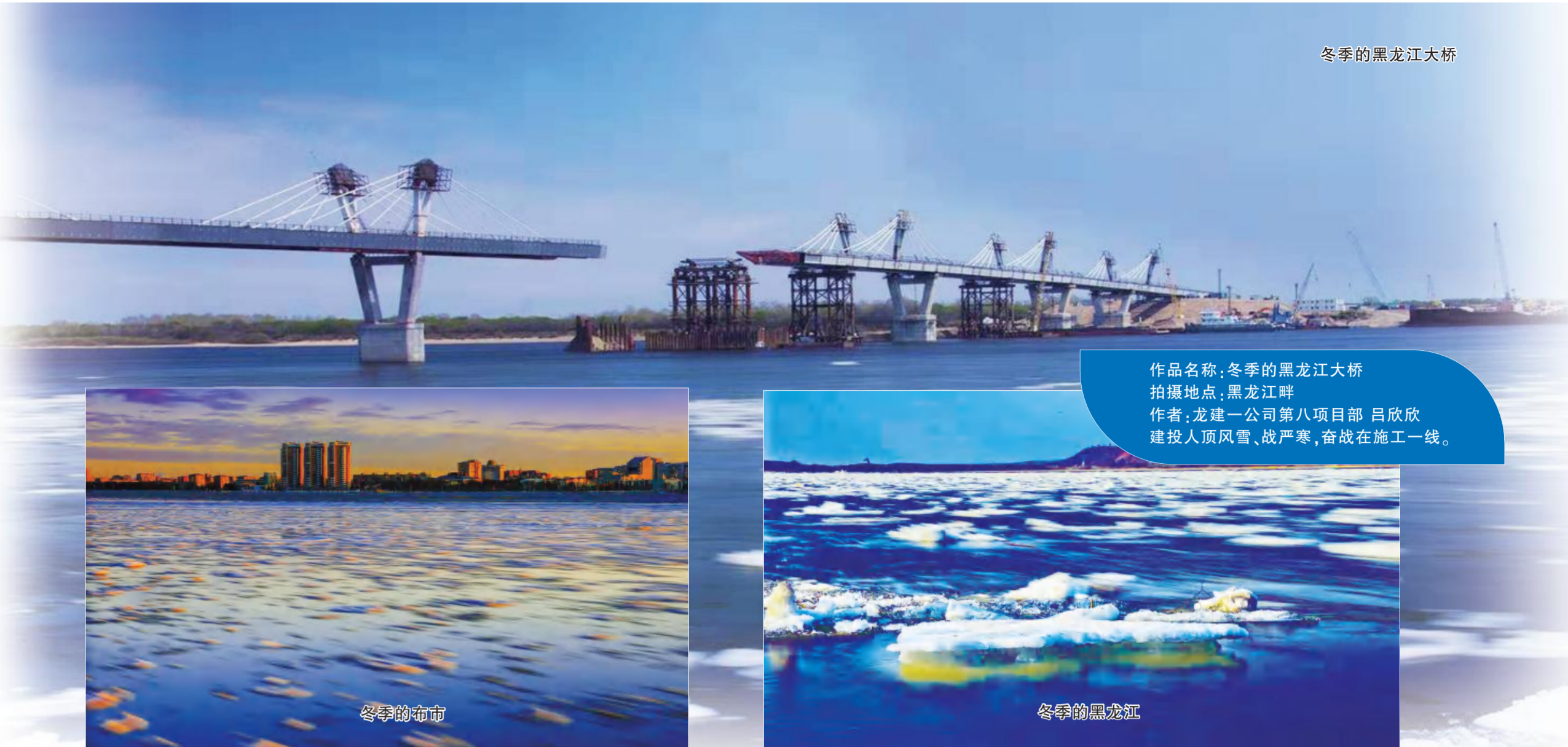
冬季的黑龙江大桥

作品名称:冬季的黑龙江大桥 拍摄地点:黑龙江畔 作者:龙建一公司第八项目部 吕欣欣 建设人顶风雪,战严寒,奋战在施工一线。